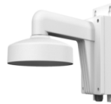
DS-1272ZJ-110B Настенный кронштейн