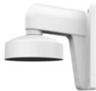
DS-1273ZJ-130-TRL Настенный кронштейн